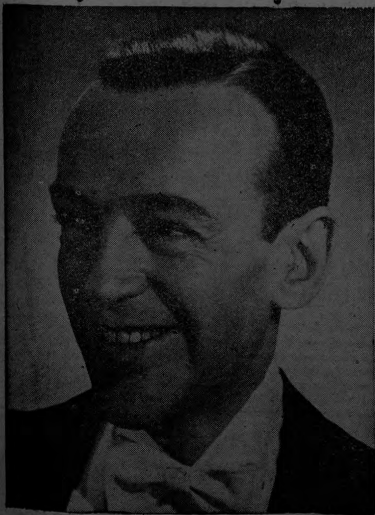
Fred Astaire Astro de la Metro-Goldwyn-Mayer

Si siquiera dos años de "retiro terapéutico" pudieron destronar al Rey de los Bailarines, Fred Astaire. Como astro de la próxima cinta